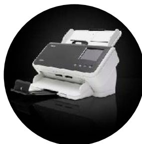
Skenery Kodak S2060w/S2080w