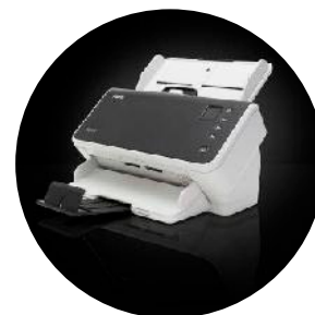
Skenery Kodak S2040/S2050/S2070